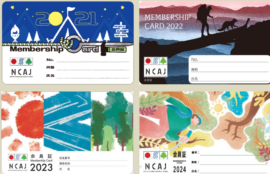
2021年から2024年の会員証デザイン

日本キャンプ協会では、毎年新しいデザインの会員証を皆さまにお届けしています。 今年も来年度の会員証デザインを決定するコンテストを開催します。 会員、非会員は問いません。たくさんの方からのご応募をお待ちしています。