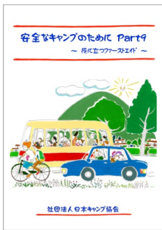
パート9 ファーストエイド