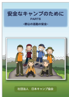
パート6 野山の活動