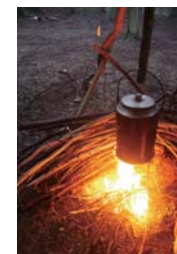
※掲載写真はもちろんイメージです。

資格はオンライン。 そのかわり キャンプにたくさん でかける。 誰かを連れて キャンプに行くなら しっかり学んでおく。