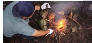
オンライン講習はキャンプ場からお届け。