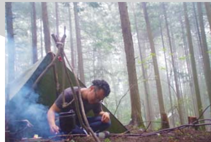
集合講習は野宿スタイルです。 (もちろん小屋やテントもOK。)